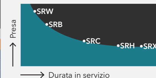
Diagramma di aderenza degli pneumatici / durata (in base alle diverse mescole)